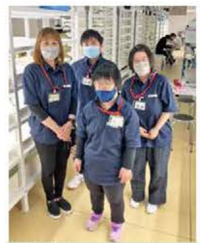
農場長とスタッフの皆さん

我々は企業として、障がい者の方たちが働く場を提供するという義務があります。これらも、障がいのあるなしに関わらず、誰もが活躍できる場を目指し、共生社会の実現に向けて会社として取り組んでいく所存です。今後は、新入社員の新人研修の一部として中物ファームを見学してもらい、中央物産としての取り組みを肌で感じてもらうなど、社員の皆さんに知っていただく機会を作っていこうと考えているところです。一緒に働く皆さんにも、その認識と理解を深めていただくと幸いです。