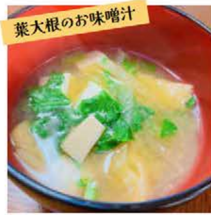
葉大根のお味噌汁